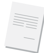
Receita médica ou odontológica

O valor a ser pago pelo medicamento é calculado automaticamente no momento da compra e avalia todos os possíveis descontos (da LPM ou da farmácia) e o subsídio do programa de acordo com sua faixa de renda.