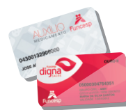
Cartão de identificação*